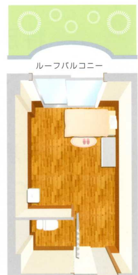
全室バルコニー付き。