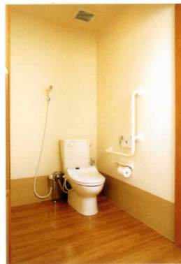
ウォシュレットトイレ付き