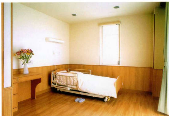
採光豊かな、明るく開放的な居室

ご入居の皆様が、使い慣れた家具や思い出の品々をご自分の部屋に持ち込んで頂くことができます。ベッド・トイレ・クローゼットは備え付けています。